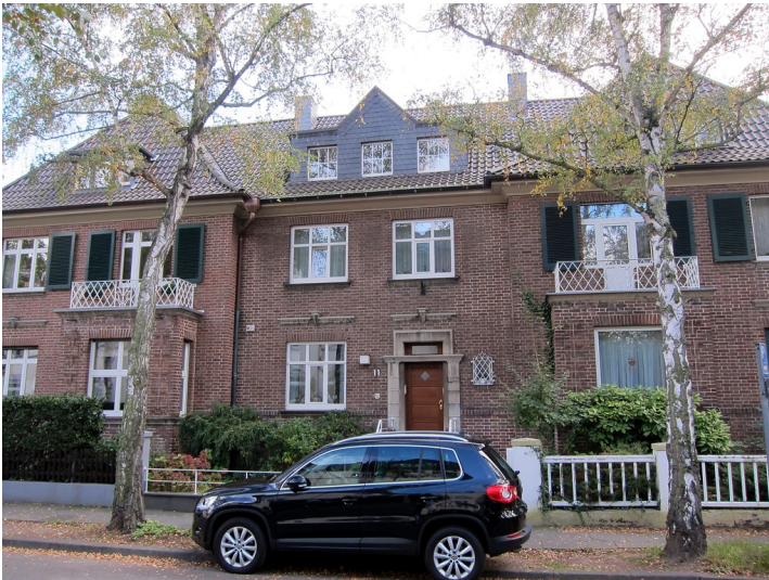
Frontseite des Wohnhauses Coburger Straße 11 in Bonn (2014)