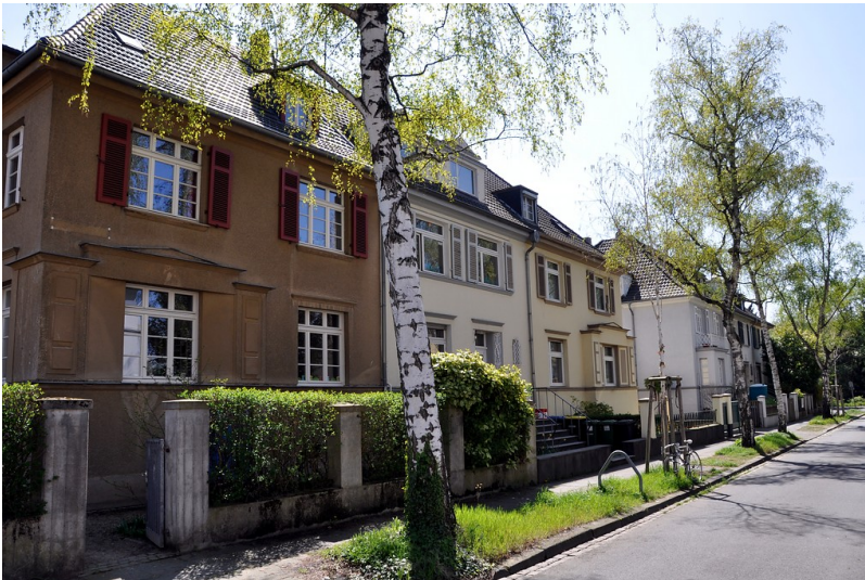
Wohnhäuser Coburger Straße 17 bis 21 in Bonn (2015)