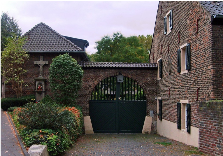
Vingster Hof in Köln-Vingst (2011)