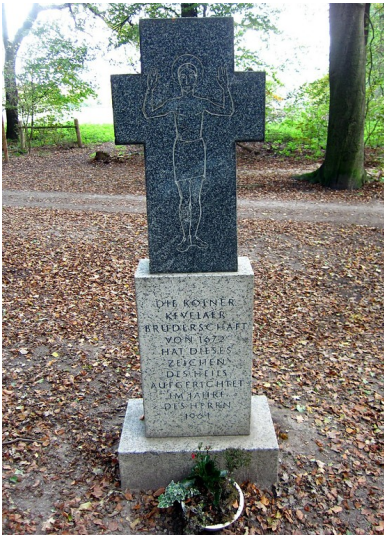
Pilgerkreuz / Pilgerstation der Kölner Kevelaer Bruderschaft im Forstwald (2011)