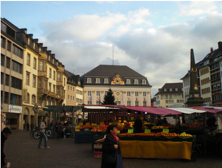
Markttag auf dem Bonner Marktplatz, in Hintergrund ist das Alte Rathaus zu sehen (2012)