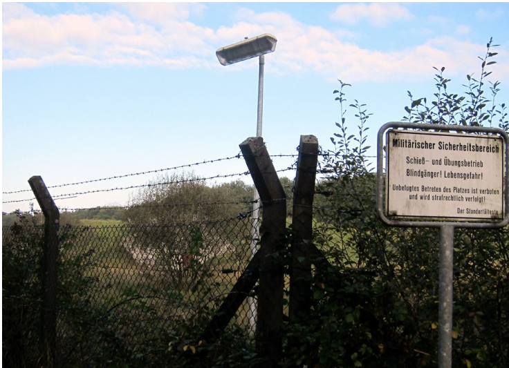
Materiallager der Bundeswehr am Camp Roi Baudouin (2011)