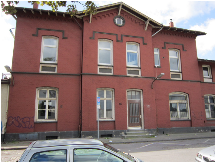
Das Empfangsgebäude des Bahnhofes Gerresheim, von der Straßenseite gesehen (2012)