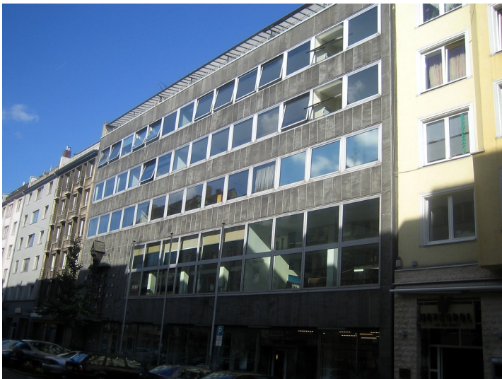
Gerhart-Hauptmann-Haus (2011)