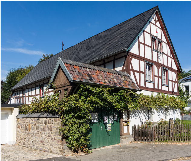
Das Gebäude des Brückenhofmuseums in der Bachstraße in Königswinter-Oberdollendorf (2013)