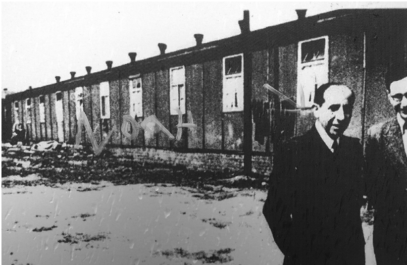
Ehemaliges Barackenlager Holbeckshof in Steele, zeitgenössisches Foto (2011)