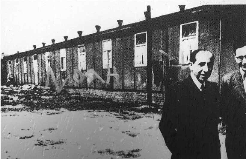
Ehemaliges Barackenlager Holbeckshof in Steele, zeitgenössisches Foto (2011) Fotograf/Urheber: unbekannt