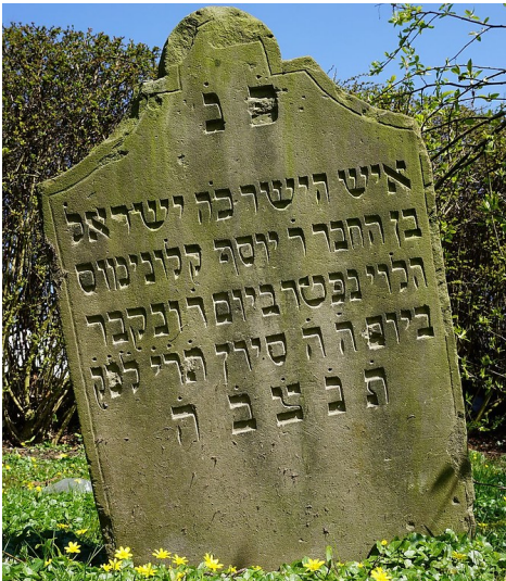
Einer der vor Ort erhaltenen Grabsteine des jüdischen Friedhofs Lanterstraße in Essen-Huttrop (2015).