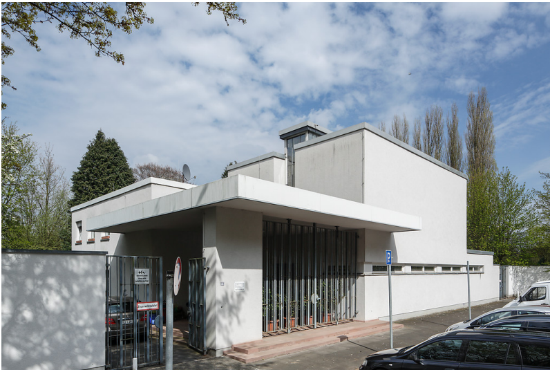
Trauerhalle des jüdischen Friedhofs auf dem Parkfriedhof in Essen-Huttrop (2013)