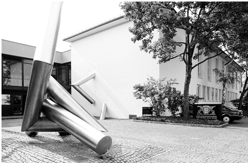
Zugang zur ehemaligen Landesvertretung Baden-Württemberg (1999)