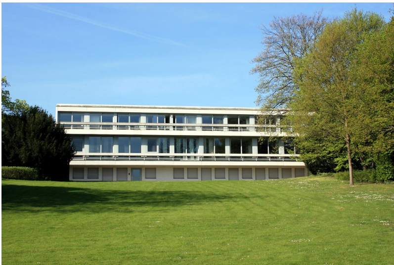
Teilansicht der Landesvertretung von Nordrhein-Westfalen beim Bund in der Bonner Dahlmannstraße, hier die Ansicht vom Wilhelm-Spiritus-Ufer aus (2015)