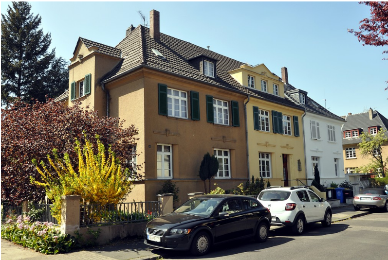
Wohnhäuser Eduard-Pflüger-Straße 50-54 in Bonn (2015)