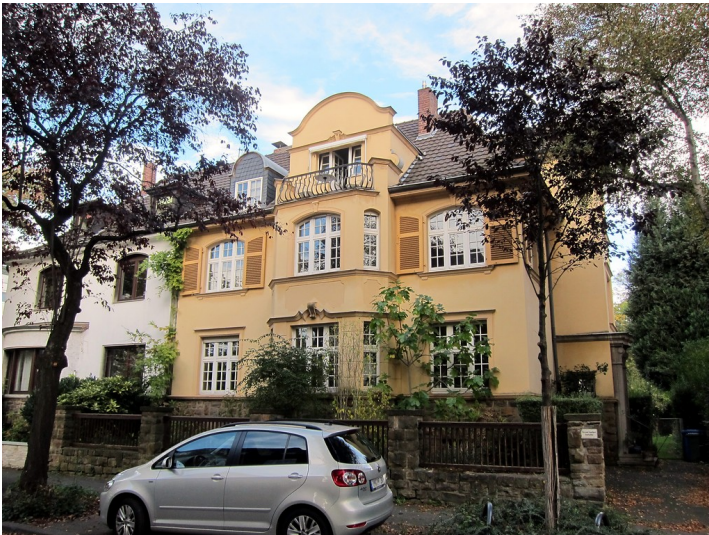
Frontansicht des Wohnhauses Eduard-Pflüger-Straße 41 in Bonn (2014)