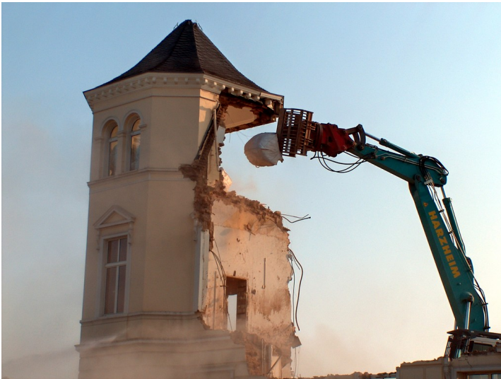
Ein Abrisssbagger nagt an den Resten eines Turms der früheren "Villa Dahm", einst Sitz der Parlamentarischen Gesellschaft im früheren Bonner Gronauweg (2005).