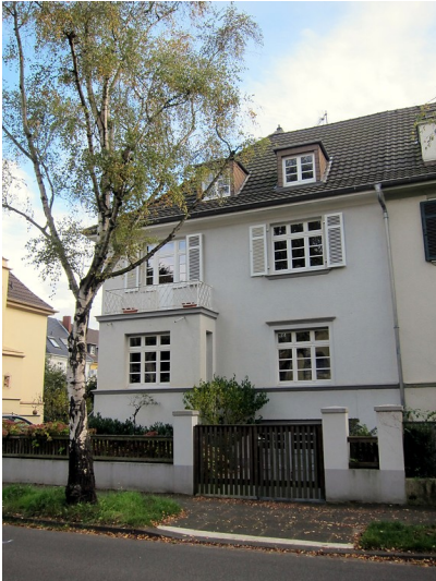
Frontansicht des Wohnhauses Coburger Straße 23 in Bonn (2014)