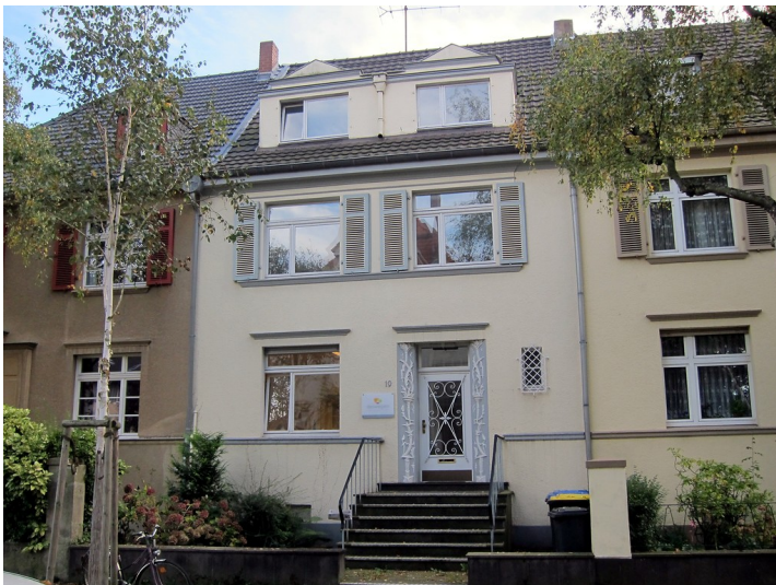
Frontansicht des Wohnhauses Coburger Straße 19 in Bonn (2014)