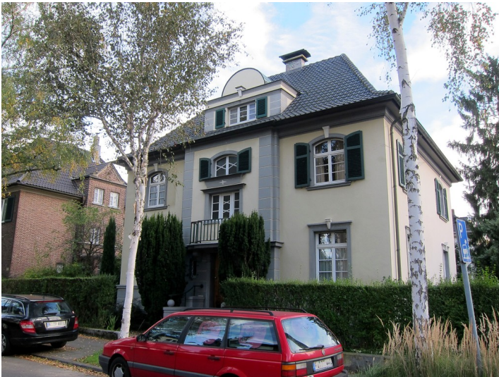
Wohnhaus Coburger Straße 15 / Ecke Eduard-Pflüger-Straße in Bonn (2014)