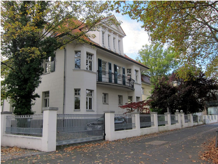
Die Villa Willy-Brandt-Allee 18 in Bonn (2014). Die Villa beherbergte bis zu ihrem Auszug die Kanzlei der Botschaft der Republik Indien.