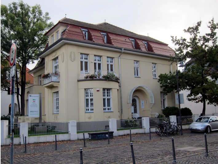
Villa Willy-Brandt-Allee 16 in Bonn vom Rheinweg aus gesehen (2014)