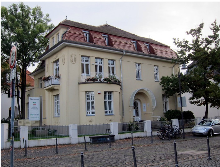
Villa Willy-Brandt-Allee 16 in Bonn vom Rheinweg aus gesehen (2014)