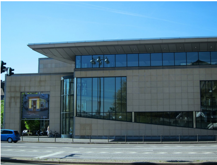
Haus der Geschichte der Bundesrepublik Deutschland, Willy-Brandt-Allee 14 in Bonn (2015).