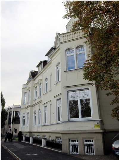
Wohnhaus Willy-Brandt-Allee 10 in Bonn (2014)