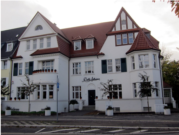
Wohnhäuser Willy-Brandt-Allee 6 (rechts) und 8 (links) in Bonn (2014)