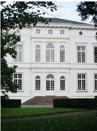
Teilsicht der Westfassade des Palais Schaumburg in Bonn (2014)