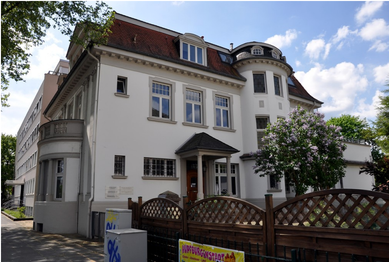
Wohnhaus Adenauerallee 132a in Bonn (2016), Sitz des Iberischen Clubs