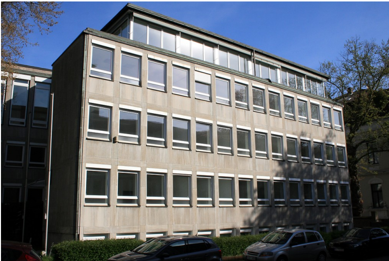
Das Bürogebäude Adenauerallee 131a / Ecke Kaiser-Friedrich-Straße im Bonner Regierungsviertel (2015).