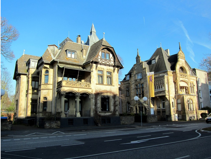
Die Villen Ermekeil / Biesenbach und Ermekeil / Eschbaum in der Adenauerallee in Bonn (2015).