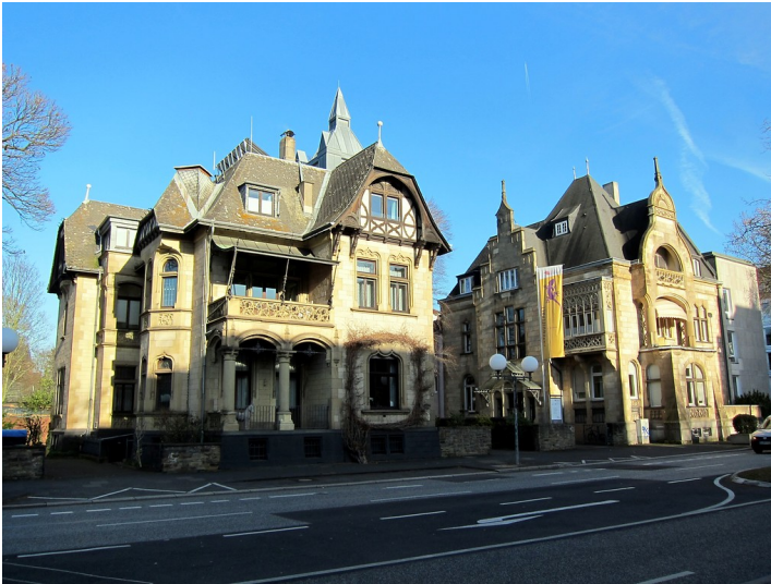
Die Villen Ermekeil / Biesenbach und Ermekeil / Eschbaum in der Adenauerallee in Bonn (2015).