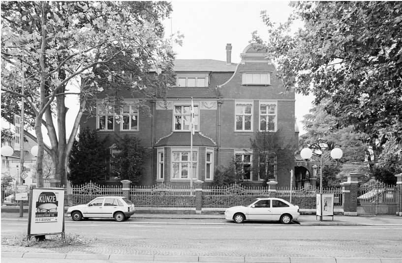
Ehemalige Kanzlei der Botschaft der Republik Korea in Bonn (1999)