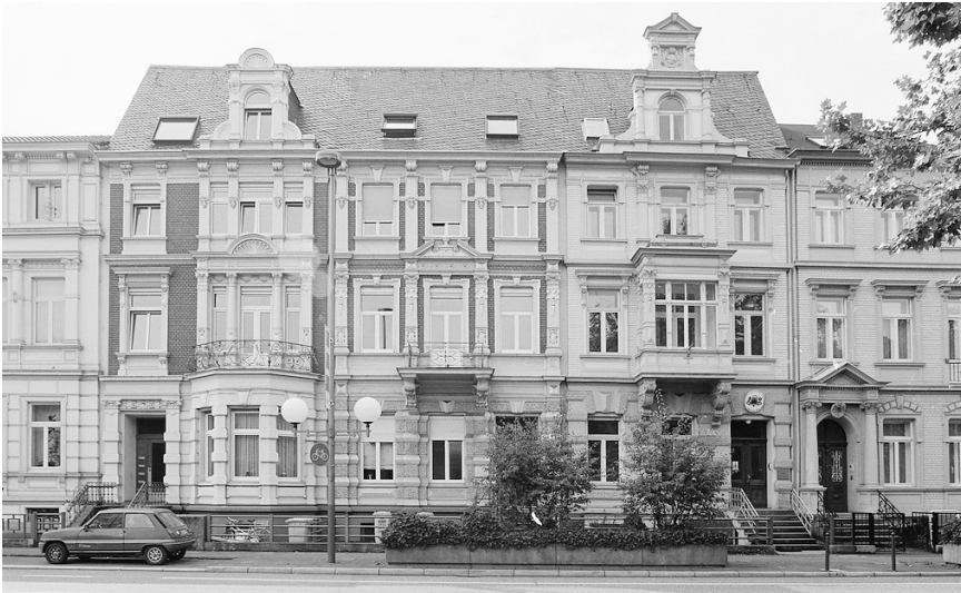
Ehemalige Kanzlei der Botschaft der Republik Lettland in Bonn, Adenauerallee 110-114 (1999)