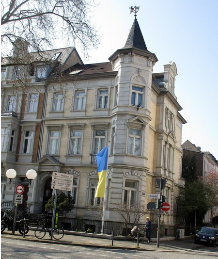
Das 1889/90 erbaute dreigeschossige Eckwohnhaus an der Ecke Adenauerallee / Arndtstraße in Bonn-Gronau (2022).