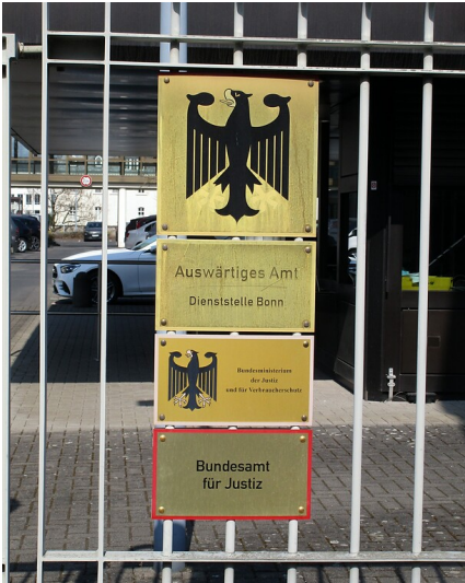
Tafeln am Zufahrt- und Eingangsbereich zum heutigen Zweitsitz des Auswärtigen Amtes in der Tempelstraße in Bonn-Gronau (2022). Fotograf/Urheber: Franz-Josef Knöchel; Henkel; Eckhard