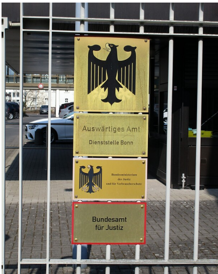
Tafeln am Zufahrt- und Eingangsbereich zum heutigen Zweitsitz des Auswärtigen Amtes in der Tempelstraße in Bonn-Gronau (2022).