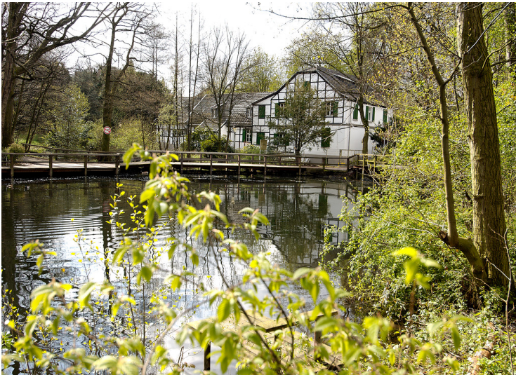
Blick über den ehemaligen Hüttenteich auf das frühere Kontorhaus und Wohnhaus des Hüttenleiters