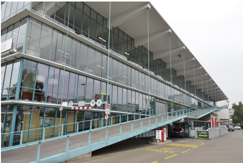
Hanielgarage an der Grafenberger Allee in Düsseldorf (2014).