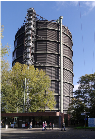
Gasometer in Oberhausen (2019)