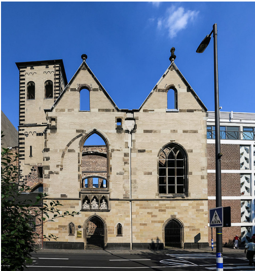
Fassade der Kirchenruine Alt Sankt Alban in Köln (2014).