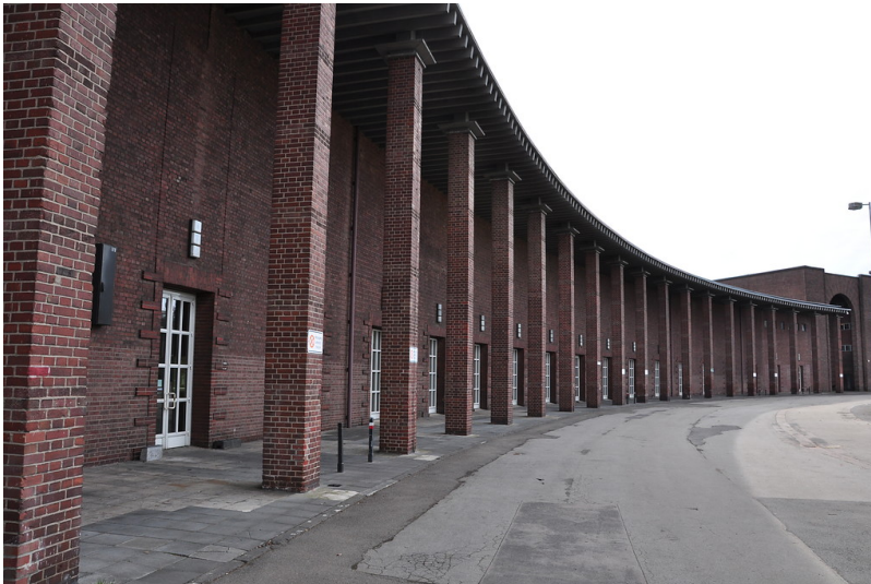
Fassade des Staatenhauses am Tanzbrunnen