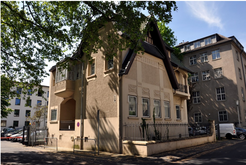
Wohn- und Bürohaus Adenauerallee 91a in Bonn (2016)