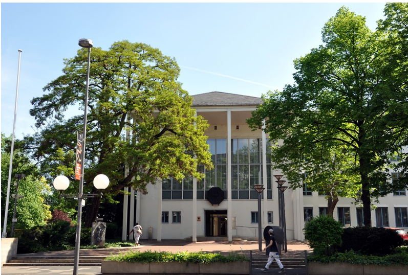
Eingangsbereich des ehemaligen Bundespostministeriums in der Adenauerallee in Bonn (2016)