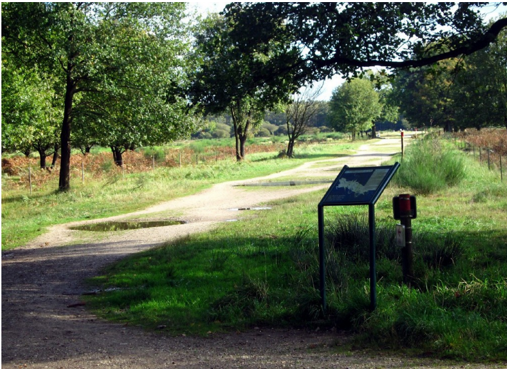
Der Wolfsweg in der Wahner Heide (2011).