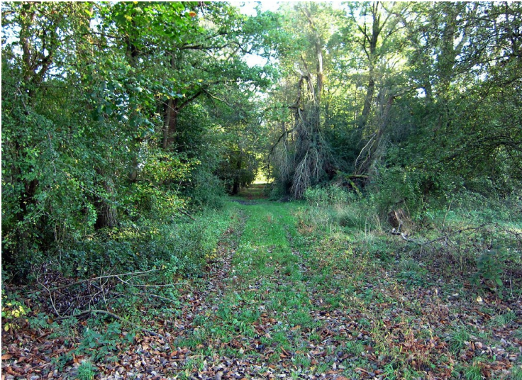
Alte Allee in der Wahner Heide (2011)