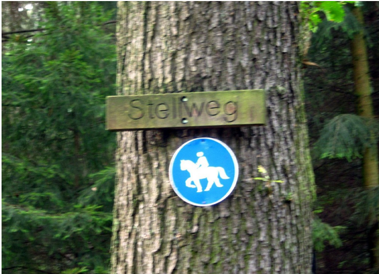
Stellweg in der Wahner Heide (2011)