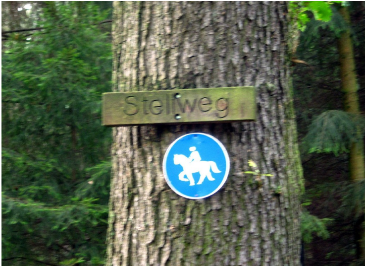
Stellweg in der Wahner Heide (2011)