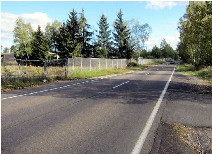
Die heutige "Alte Kölner Straße" an der Wahner Heide (2011).