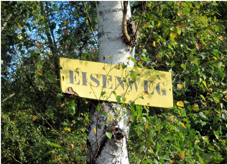
Hinweisschild auf den Eisenweg von Spich nach Lohmar (2011).