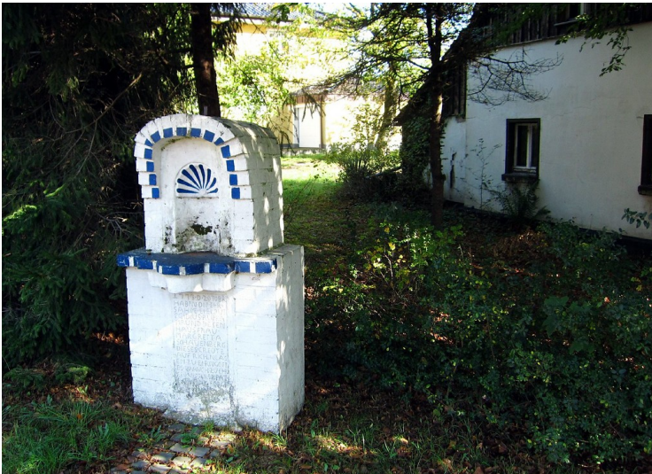
Bildstock Ecke Brandstraße / Heidegraben in Altenrath (2011)