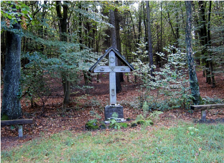
Wegkreuz "Stompe-Krüzge" bzw. "Stompe Krüzge" am Eisenweg (2011).